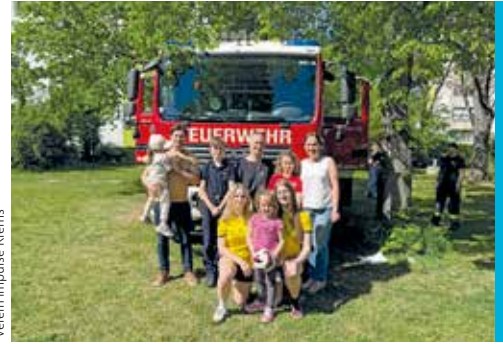
Verein Impulse Krems