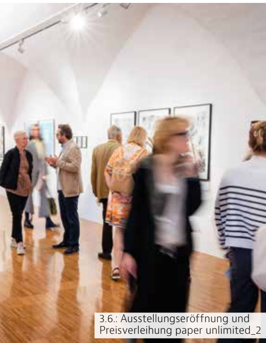
3.6.: Ausstellungseröffnung und Preisverleihung paper unlimited_2