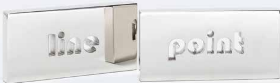
Jorit Aust / Bildrecht