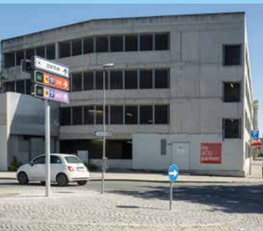
Auf einen Blick: das neue Parkleitsystem zeigt die verfügbaren Parkplätze live an, wie hier beim Parkdeck SÜD.