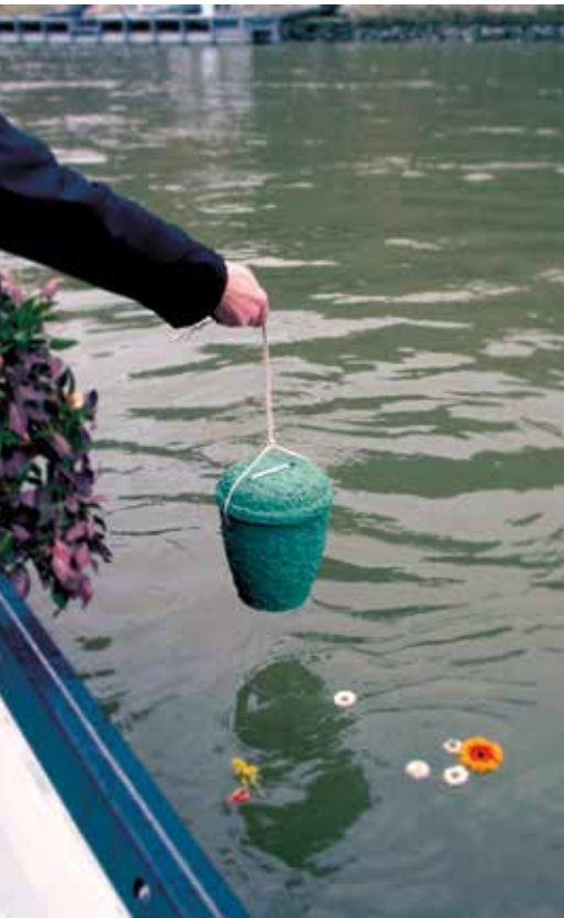
Illumina Photography e. U.