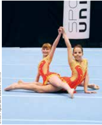
Union Sportakrobatik Krems