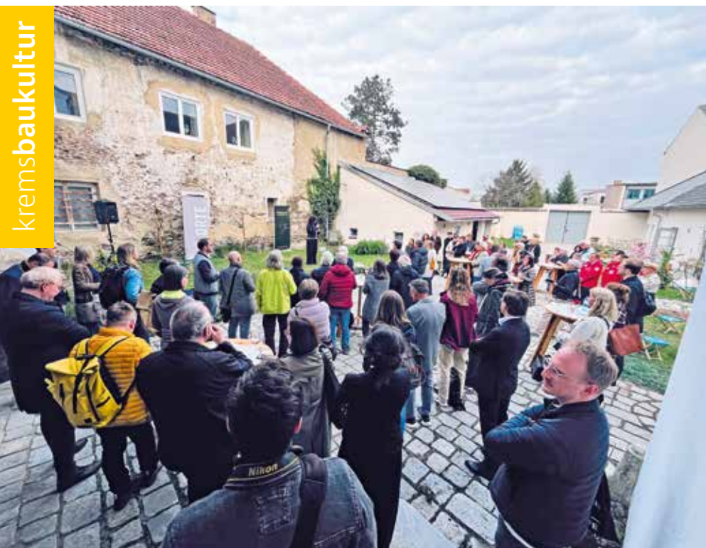
Eröffnung der Ausstellung Haus Hof Dorf in Langenlois am 16. April

zeigen Potenziale auf. Anhand von Best-Practice-Beispielen – und davon gibt es einige – werden Strategien für qualitativollen Lebensraum mit einer starken sozialen Mitte vorgestellt. Ergänzend werden rechtliche Rahmenbedingungen, Leitlinien für das Bauen sowie mögliche Förderinstrumente erklärt.