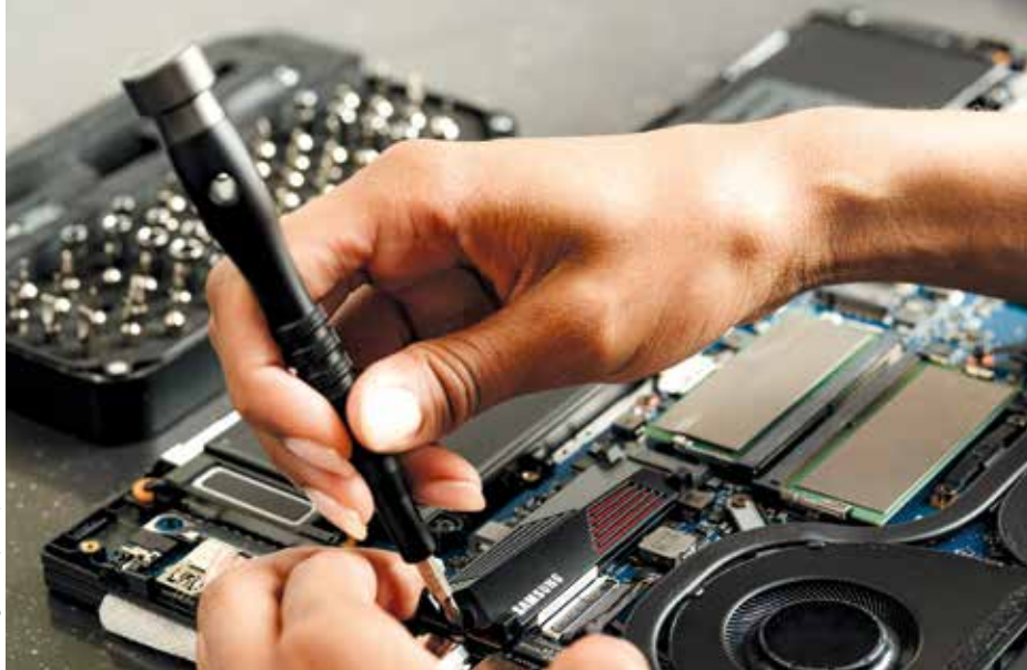
samsung memory / unsplash

baut oder ein Staubsaugerrohr nachkauft, erhält keinen Zuschuss. Doch selbst ohne Reparatur-Bon bleibt der Wert alter Smartphones hoch. Stichwort „Urban Mining“: In den Geräten stecken wertvolle Metalle wie Gold, Silber oder seltene Erden. Ein altes Handy gehört daher keinesfalls in den Restmüll, sondern sollte über ReUse-Programme weitergegeben oder fachgerecht recycelt werden.