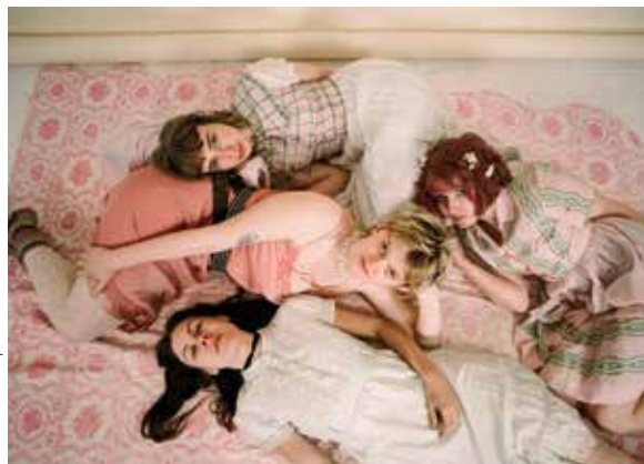
The New Eyes © promo