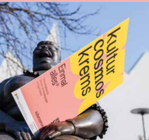
Die Institutionen der Kunstmeile KREMS sind auch mit Angeboten im Kultur Cosmos KREMS vertreten. Der Deix-Figur gefällt das auch.

Mehr Einblicke in den Cosmos gibt es auch beim 4. KREMSER Bildungstag am 27. April 2026 – und natürlich jederzeit auf www.kulturcosmos-krems.at