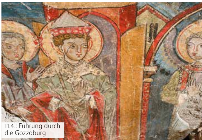
11.4.: Führung durch die Gozzoburg