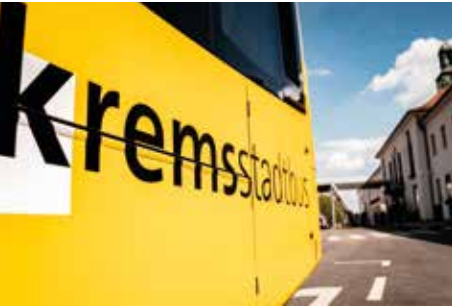
Robin König Media