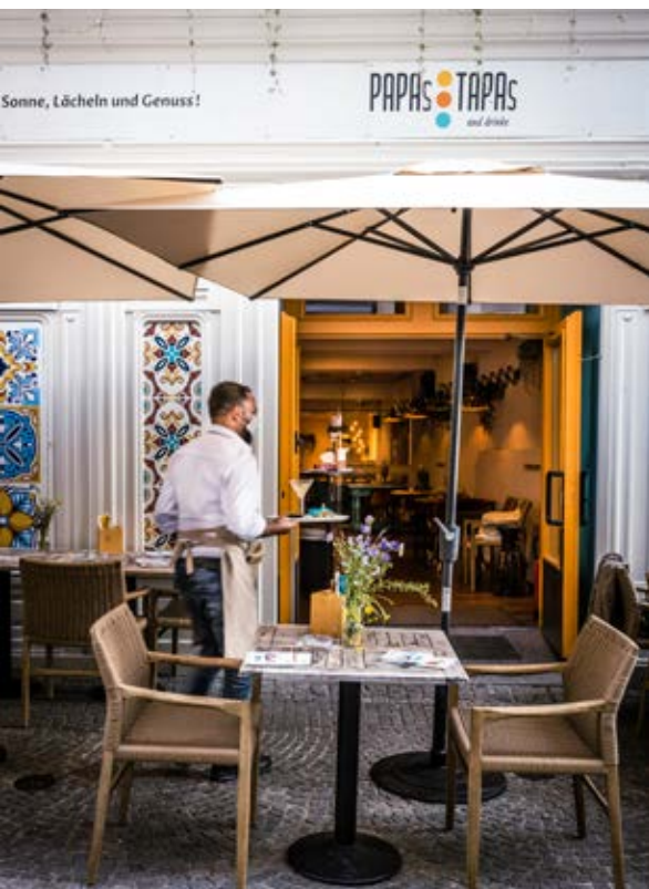
Text und Fotos: Pamela Schmatz