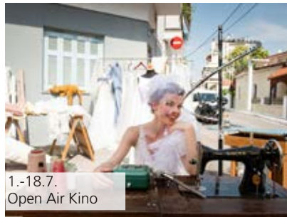
1.-18.7. Open Air Kino