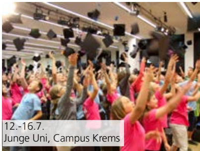
12.-16.7. Junge Uni, Campus Krems