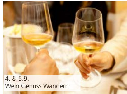
4. & 5.9. Wein Genuss Wandern